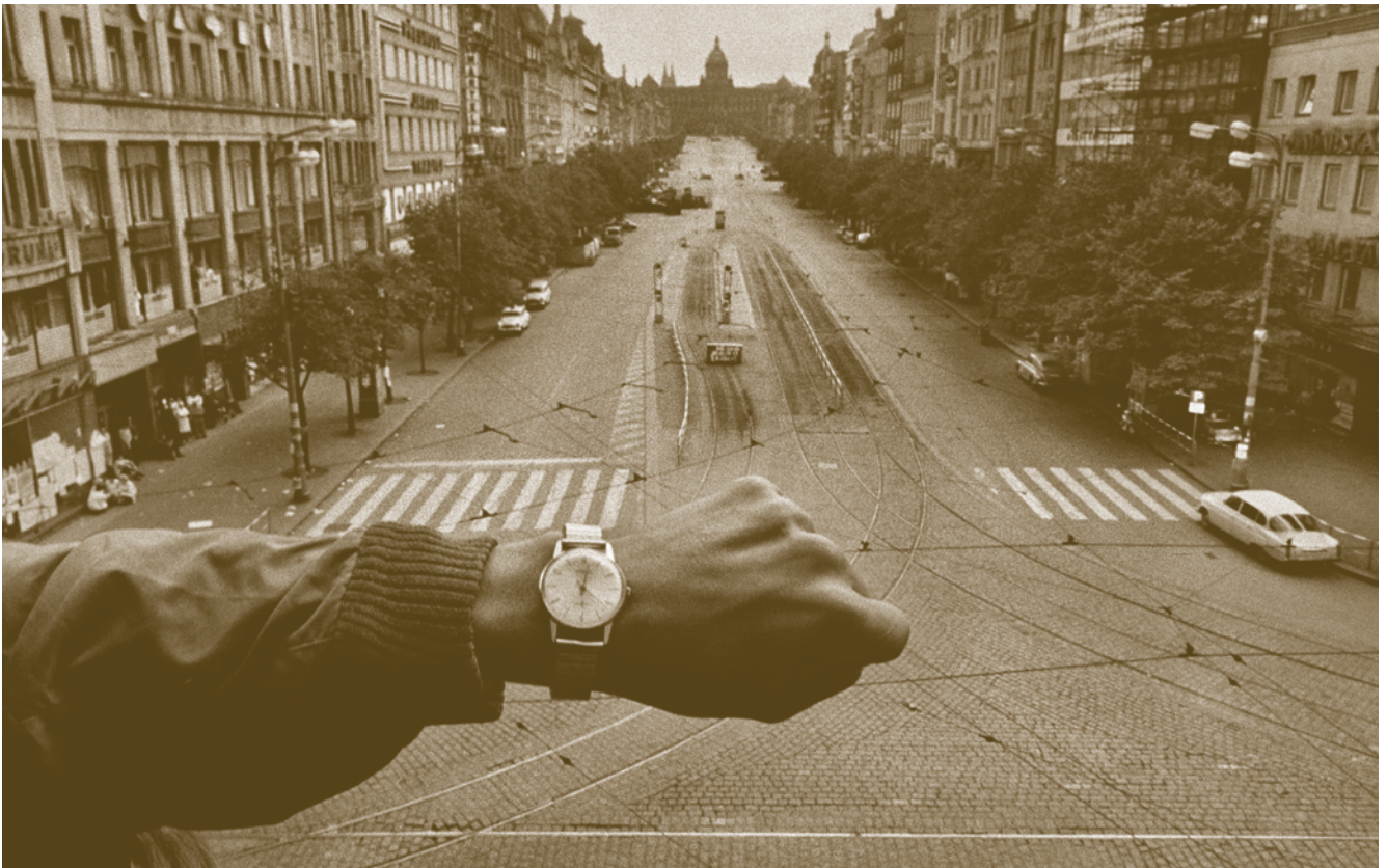
Prázdné Václavské náměstí 23. srpna 1968 po dobu generální stávky.

článek v časopisu Reportér z 25. prosince 1968